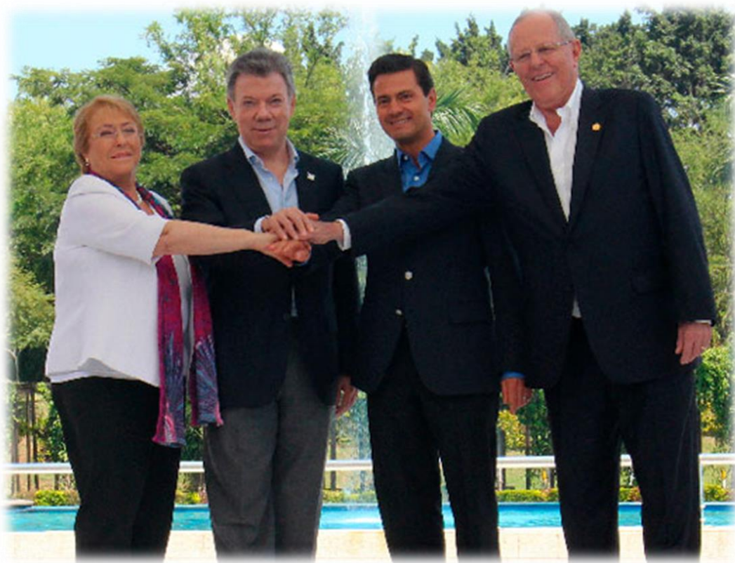
XII Cumbre de la Alianza del Pacífico. Cali, Colombia